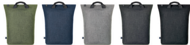
green sprinkle (717) blue sprinkle (716) light grey sprinkle (728) grey-sprinkle (638) black-sprinkle (678)

Siebdruck; Stick; Transferdruck; Digitaldrucklabel; Metallembem; Geschenkkarton (2)