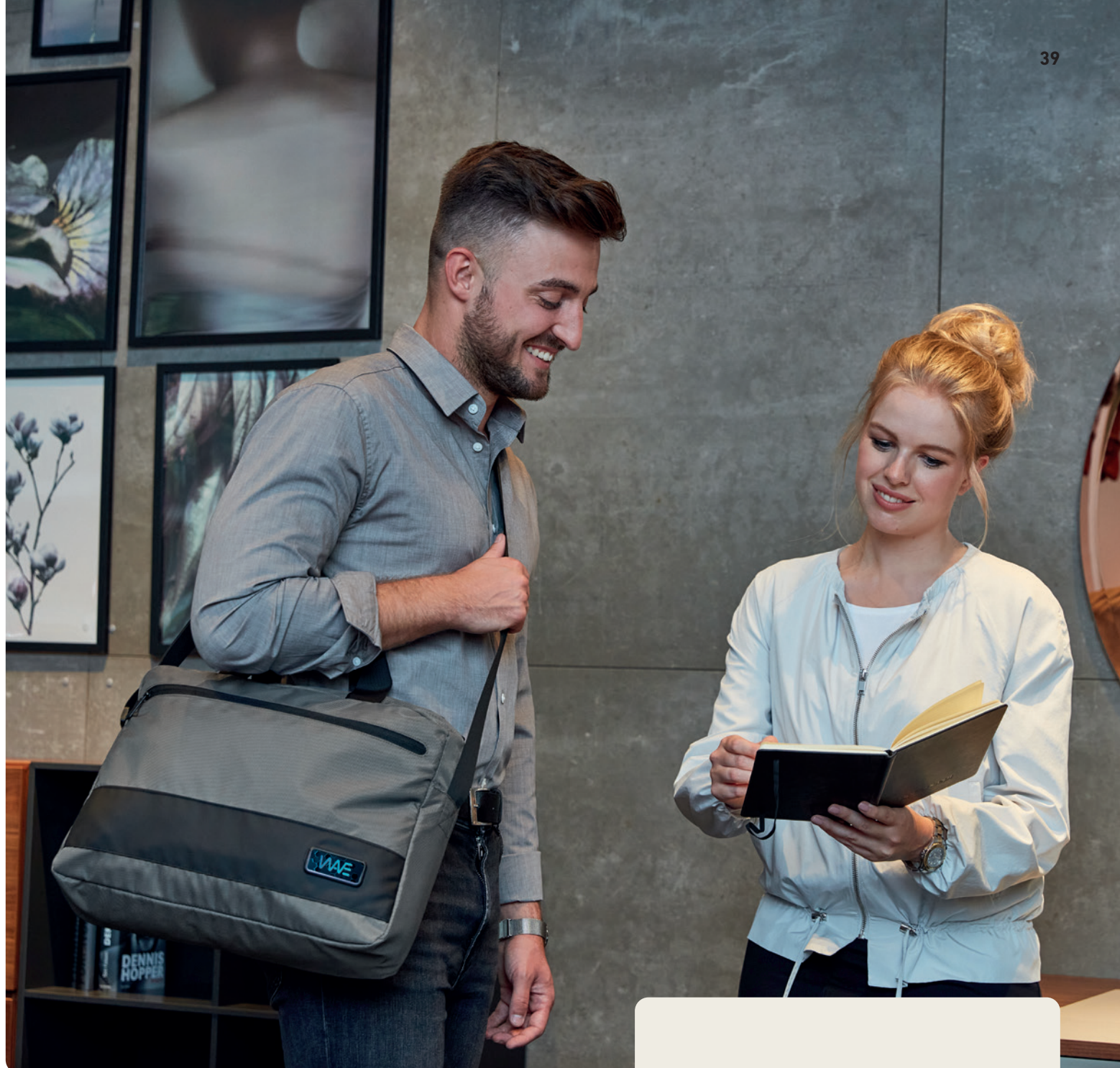
1816087 STAGE Notebook-Tasche notebook bag 50

STAGE – BÜROBEGLEITER MIT FREIZEIT- FEELING.