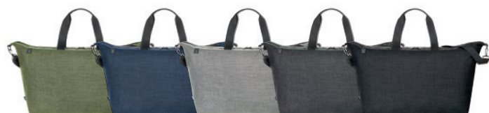
green sprinkle (717) blue sprinkle (716) light grey sprinkle (728) grey-sprinkle (638) black-sprinkle (678)

Siebdruck; Stick; Transferdruck; Digitaldrucklabel; Metallembem; Geschenkkarton (2)