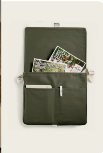
1816504 LIKE Umhängetasche shoulder bag ☐ 48