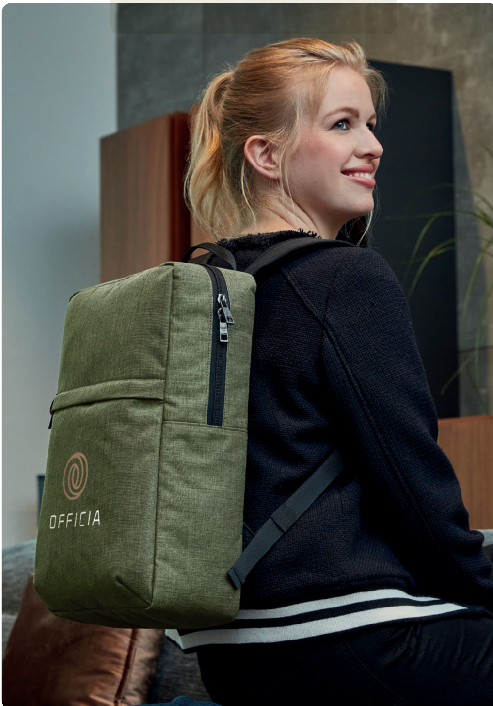
1816517 EUROPE Laptop-Rucksack laptop backpack 📏 45