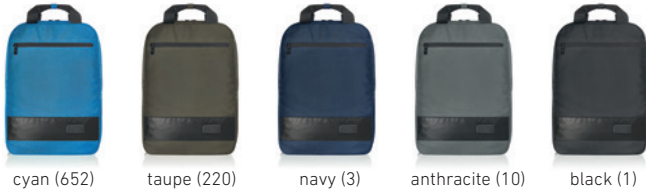
cyan (652) taupe (220) navy (3) anthracite (10) black (1)