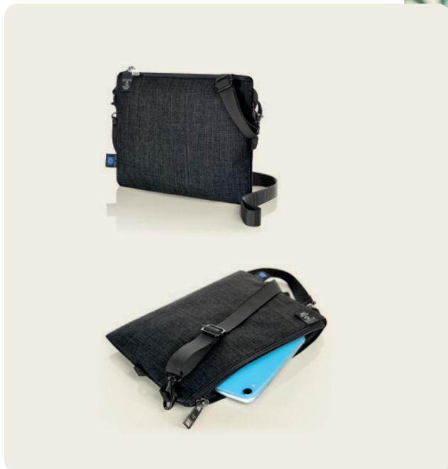
1816516 EUROPE Reißverschluss-Tasche zip bag 44