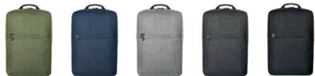
green sprinkle (717) light grey sprinkle (728) black-sprinkle (678) blue sprinkle (716) grey-sprinkle (638)

Siebdruck; Transferdruck; Stick; Digitaldrucklabel; Metallembem; Geschenkkarton (9)