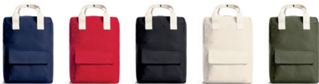
navy (3) red (5) black (1) nature (704) olive (56)