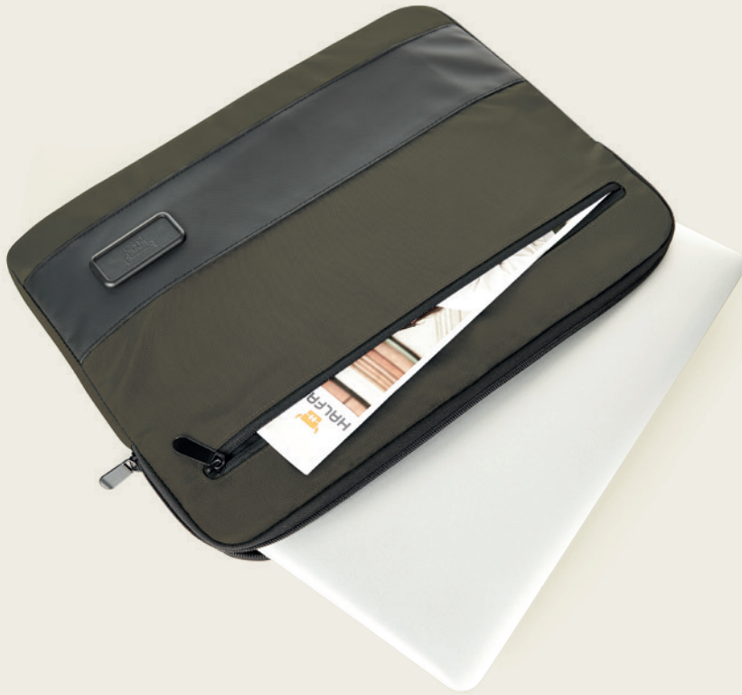
1816088 STAGE Laptop-Mappe laptop bag 📏 51