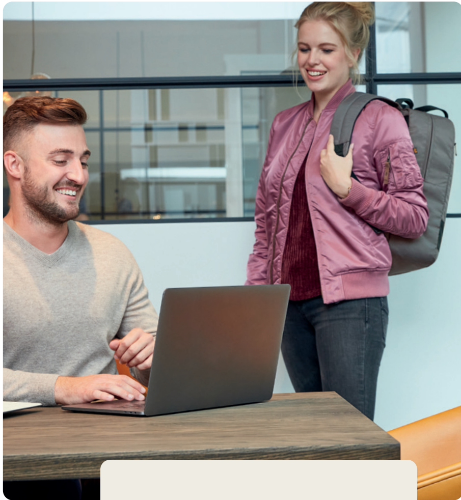
1816090 STAGE Multibag multi bag 📏 50