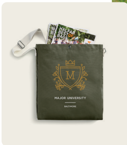
1816506 LIKE Shopper shopper ☐ 48