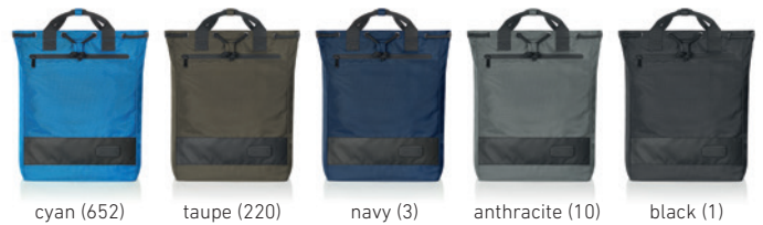
cyan (652) taupe (220) navy (3) anthracite (10) black (1)

HALFAR FAST LANE®; Siebdruck; Stick; Transferdruck; Doming; Metallemblem; Digitaldrucklabel; Geschenkkarton (1)