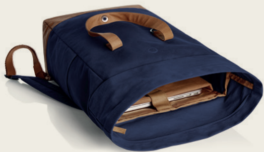
1816520 LIFE Notebook-Rucksack notebook backpack 📏 46