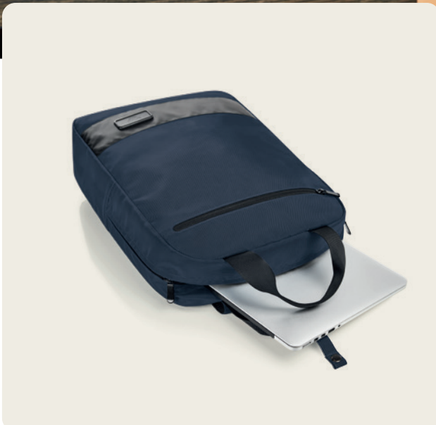
1816089 STAGE Notebook-Rucksack notebook backpack 📏 50