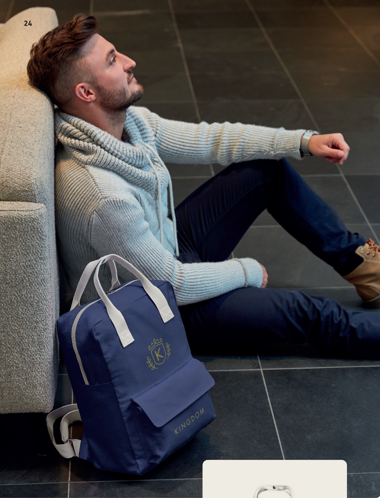
1816505 LIKE Rucksack backpack ☐ 48