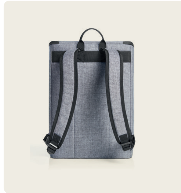
1816503 TREND Kühl-Rucksack cool backpack ☐ 51