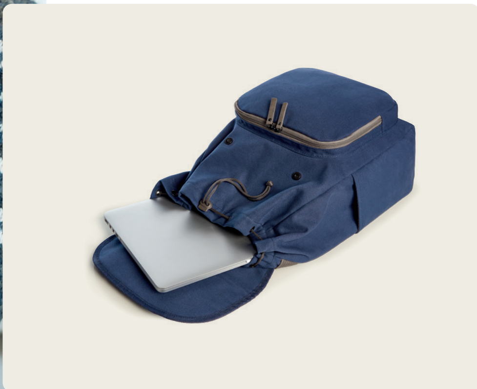
1816502 COUNTRY Notebook-Rucksack notebook backpack ☐ 47