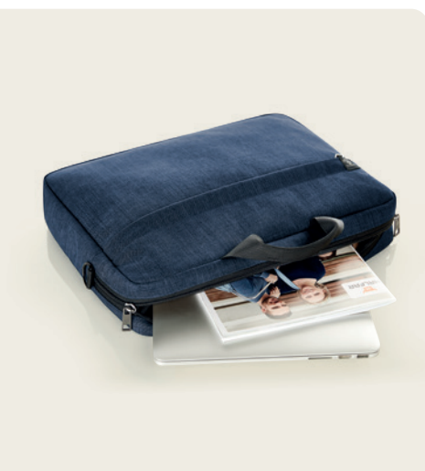
1816515 EUROPE Notebook-Tasche notebook bag ☐ 44