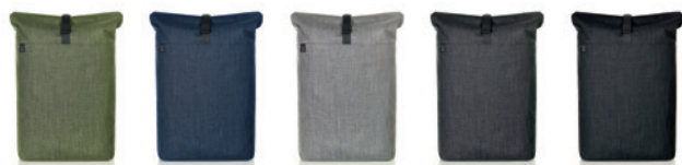
green sprinkle (717) blue sprinkle (716) light grey sprinkle (728) grey-sprinkle (638) black-sprinkle (678)