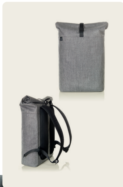
1816510 EUROPE Notebook-Rollrucksack notebook roller backpack ☐ 45